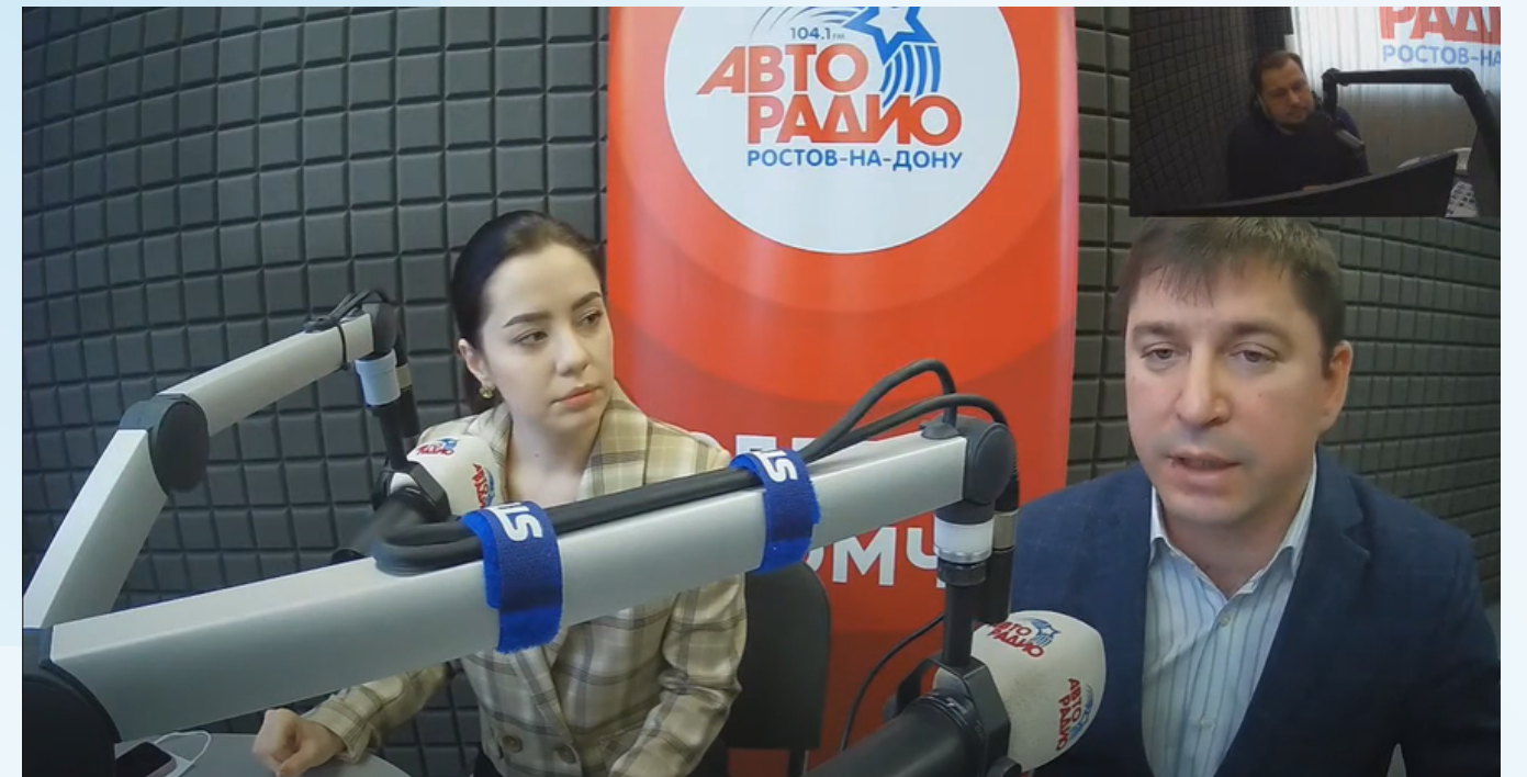
Эфиры «ФМ на Дону», «Авторадио»

● В электронных СМИ опубликовано более 20 статей